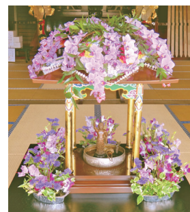
花御堂 (はなみどう)

3/31~4/8の間、本堂に上がって、花御堂の誕生仏に甘茶をかけてください。花御堂脇にあるポットの温かい甘茶も、山門の桜を見ながらお召し上がりください。