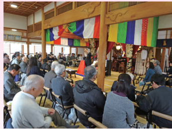
平成31年 春彼岸法要