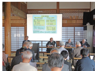
平成31年 春彼岸世話人会

令和元年秋彼岸の世話人会では本堂トイレ改善の要望があり、温水洗浄便座への改修を行いました。