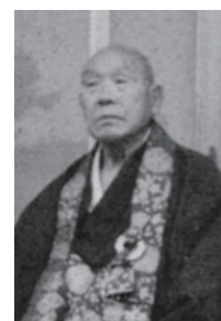
二十九世 (谷内)千秋流芳大和尚